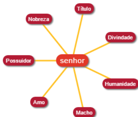
FIGURA 1 – Rede semântica da palavra senhor

Fonte: < http://www.aulete.com.br/senhor >